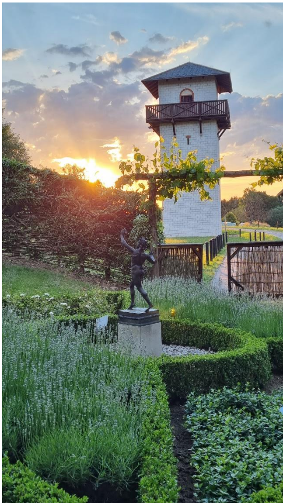
Limesturm 1/68, Bild: Manfred Knobloch

Sehenswürdigkeiten zum Limes in Hillscheid erkunden. Der rekonstruierter Limesturm (1/68), der ein kleines Museum beinhaltet, ist sicherlich die Attraktion zum